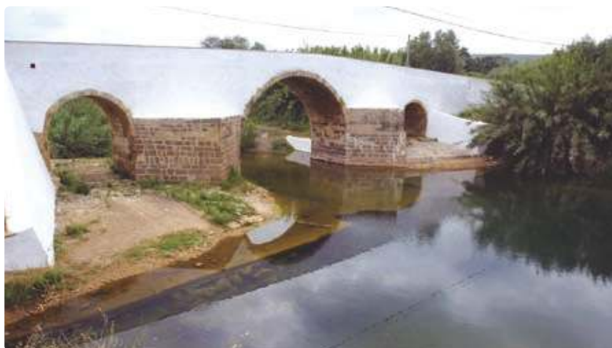
Ponte da Tôr Tôr Bridge

Património Classificado Classified Heritage