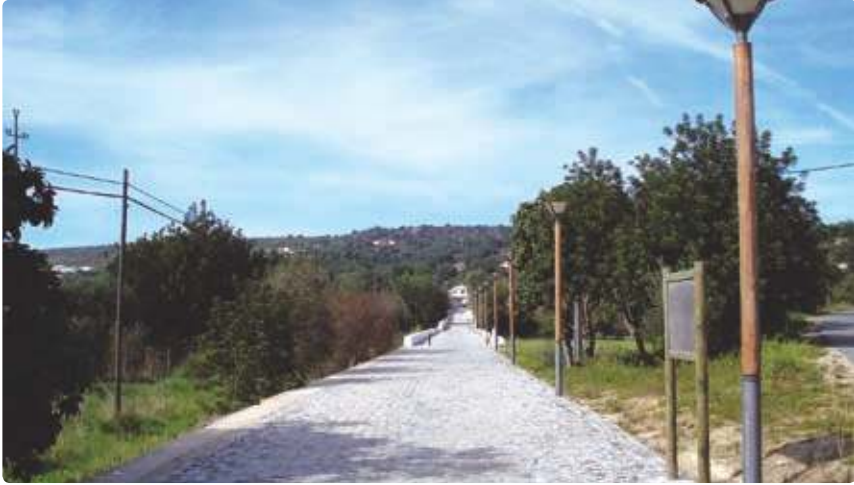
Ponte de Tôr Tôr Bridge

Incrustada numa colina em pleno Barrocal Algarvio, situa-se a aldeia da Tôr, voltada a Sul, a olhar a ribeira com o mesmo nome. Distingue-se sobretudo por um traço urbanístico tradicional, que lhe dá encanto e simpatia, com as suas ruas estreitas e sinuosas, por entre a brancura do casario.